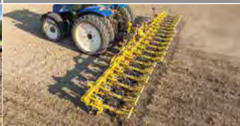
Pielniki międzyrzędowe ROW-MASTER