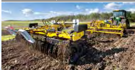
Wały doprawiające ciągnane CUTTERPACK, PRESSPACK, GALAXY