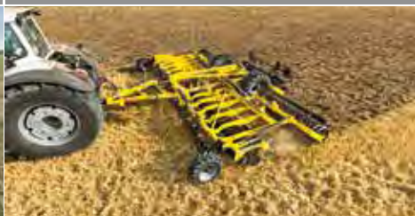
Brony talerzowe SWIFTERDISC